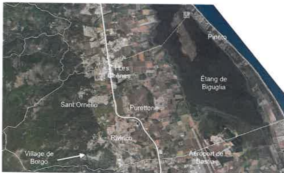
Figure 1: Localisation des zones bâties de Borgo

Borgo est la quatrième ville de Corse. La commune fait partie de l'aire urbaine de Bastia, notamment grâce à l'axe direct qui traverse le territoire communal du nord au sud. En 2019, la commune comptait 8 832 habitants et est intégrée à la communauté de communes de Marana-Golo depuis 2012. La population est majoritairement regroupée dans le quartier du Rivinco, puis dans le quartier Sant Ornello/Les Chênes et Pineto sur le cordon lagunaire. Le village reste également un pôle de vie important.