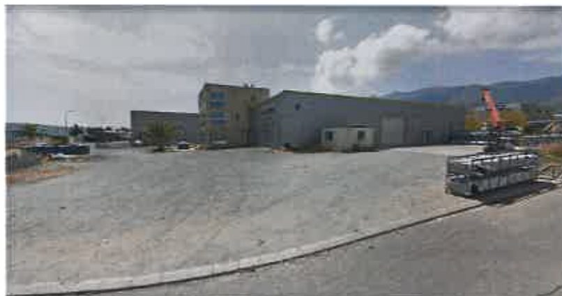
Figure 7: Zone Artisanale des Chênes

Les OAP n'ont pas fait l'objet d'analyse paysagère et ne prévoient pas de mesures d'insertion paysagère particulières. Leur emplacement est pourtant sensible, puisqu'elles se situent en entrée de ville et créeront une rupture importante avec les espaces agricoles actuels.