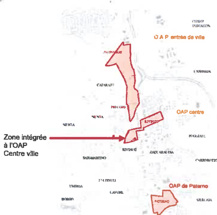
Figure 3: Localité des trois OAP de la révision

La MRAe note que l'intégration de la parcelle sud (cf schéma ci-après) au sein de l'OAP centre-ville, comme recommandé dans le précédent avis, notamment pour assurer une cohérence du centre ville de Borgo au niveau des mobilités douces a bien été retenue.