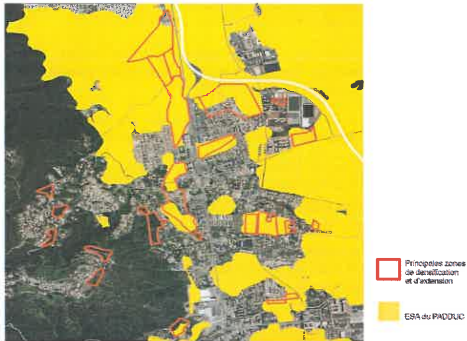
Figure 5: Zones principales de densification et extension et ESA du PADDUC

Le dossier de PLU explique la volonté de compenser les surfaces d'ESA mobilisées par la révision, en classant également des parcelles en bord de mer en tant qu'ESA, notamment des terres actuellement cultivées de 44 ha. .