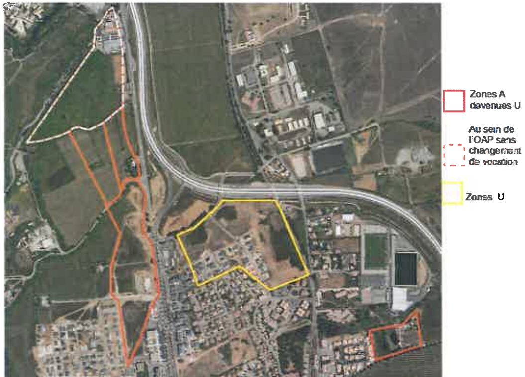
Figure 6: Les 4 zones ayant fait l'objet d'une analyse écologique des milieux

Cette analyse n'a pas été menée sur les autres parcelles en extension ou en densification, alors qu'elles sont susceptibles d'être impactées par le projet de PLU. Ainsi, aucune méthodologie de comparaison n'est exposée dans le rapport de présentation pour justifier la détermination des parcelles ouvertes à l'extension urbaine au regard des enjeux environnementaux. Même si la superficie globale en extension urbaine a diminué, le dossier n'indique pas quels choix ont conduit à retenir les parcelles maintenues dans le projet de PLU. Par exemple, on ne peut pas comprendre pourquoi, au sein de l'OAP entrée de ville, le nord a été préservé et pas l'ouest.